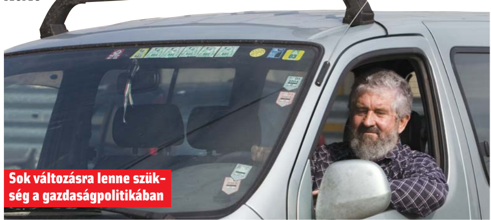
Sok változásra lenne szükség a gazdaságpolitikában

Egy család szadlában védekezhet. Ha én elfelejtem, hogy lejárt a forgalmim, munkaképtelené tesznek.