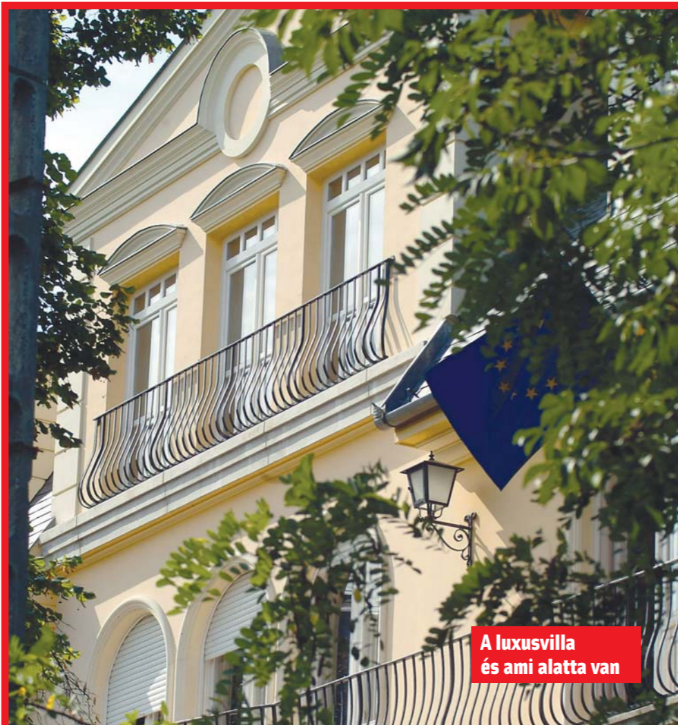
A luxúsvilla és ami alatta van

M. V.: Az emberek nagy többsége nem él jobban ma Magyarországon, mint 2002-ben, és nem érzik az uniós csatlakozásból fakadó előnyöket sem. A kormány 400 ezer új munkahelyet ígért, ezzel szemben szinte ugyanennyi embernek nincs munkája.