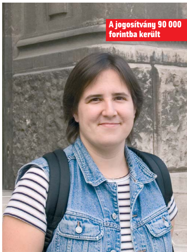
A jogosítvány 90 000 forintba került