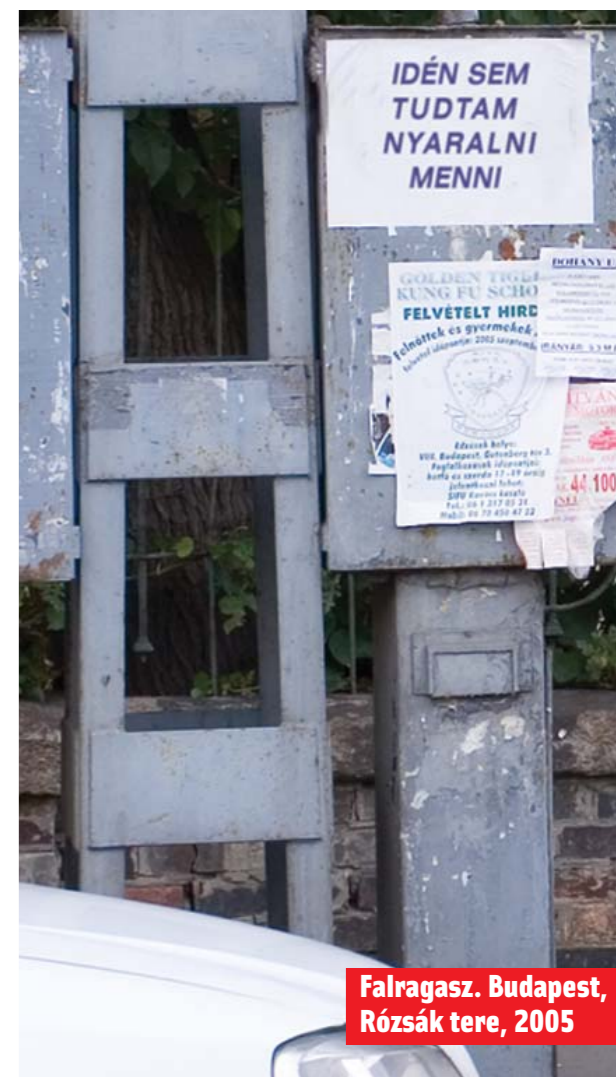
Falragasz. Budapest, Rózsák tere, 2005

Mert a jó gazda nem az, aki elad, hanem az, aki vesz, aki gyarapít.