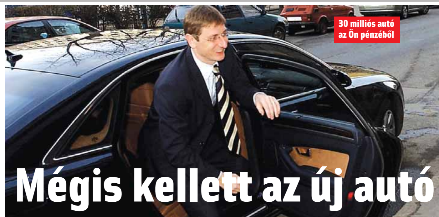
30 milliós autó az Ön pénzéből