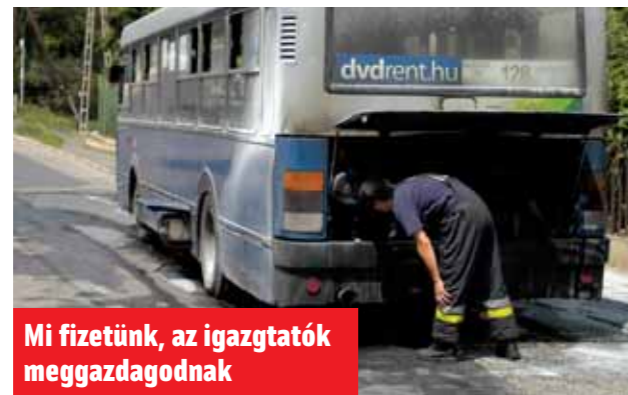
Mi fizetünk, az igazgatók meggazdagodnak

2005 második felében kirúgott MÁV-vezérigazgató közel 150 millió forintot végkielégítést kapott. Eközben a vasúttársaság az elmúlt három évben megháromszorozta a veszteségét, így az már túllépi a 80 milliárd forintot. Minek jár akkor jutalom?