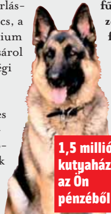
1,5 millió kutyaházra az Ön pénzéből

A szolnoki HM-bázison tizenkét fűtött kutyaólat építettek tizennyolcmillió-ötszáz ezer forintért. Nem mondható el az őrző-védő ebekről, hogy a kutya sem törődik velük. A kutyakiképző szerint sok a másfél milliós ár, mert egy fűtött kutyaólat kétszáz ezer forintból is elkészíthető. Az elkészült kutyaólatok nincsenek levalolva és a tetejük ol-