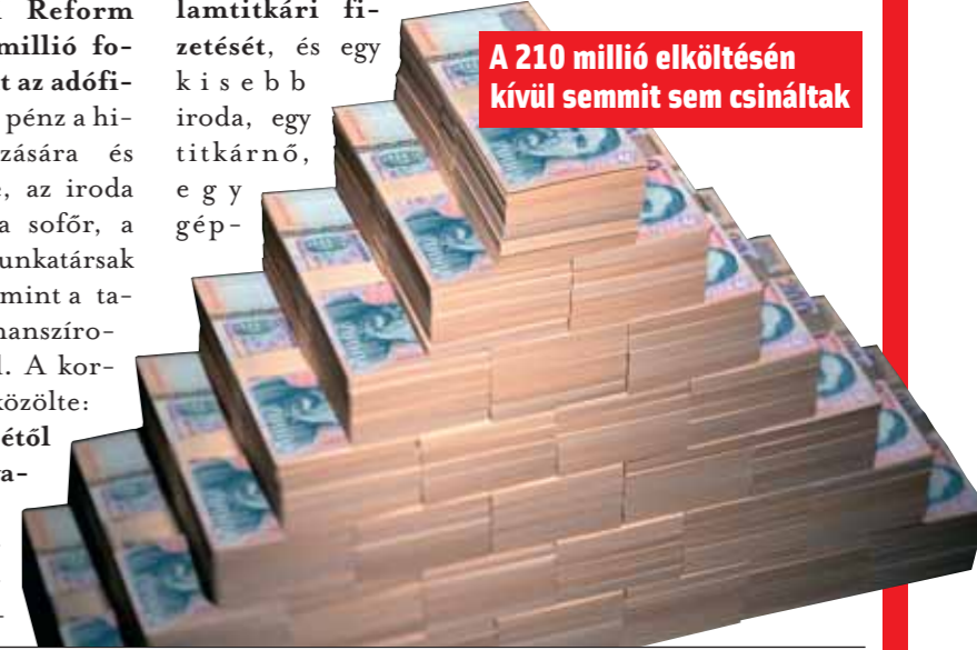
A 210 millió elköltésén kívül semmit sem csináltak

si idejét tölti, de ez idő alatt is kapja az államtitkári fizetését, és egy kisebb iroda, egy titkárnő, egy gépkocsi és egy sofőr is rendelkezésére áll!