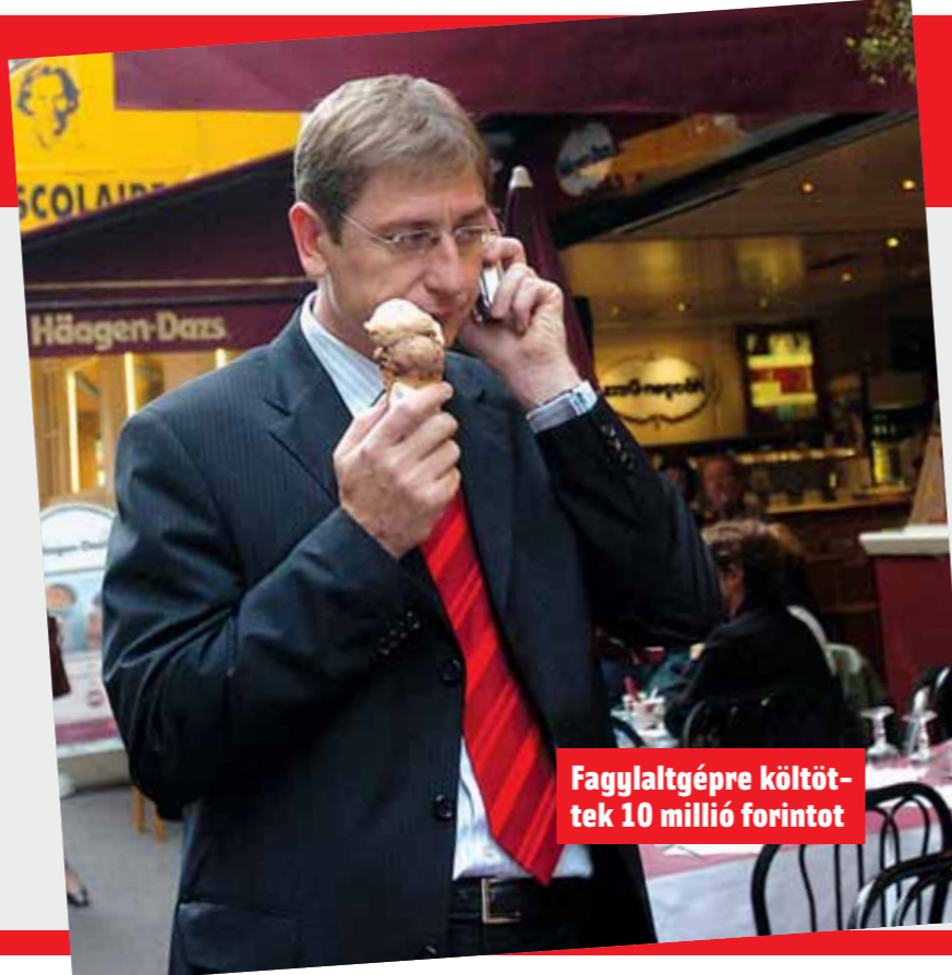
Fagyaltgépre költöttek 10 millió forintot